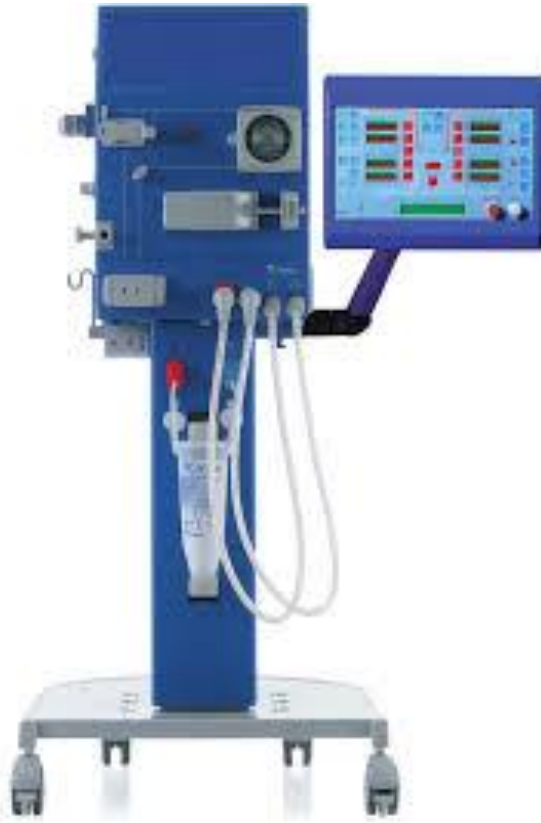
Gambro AK 95 s