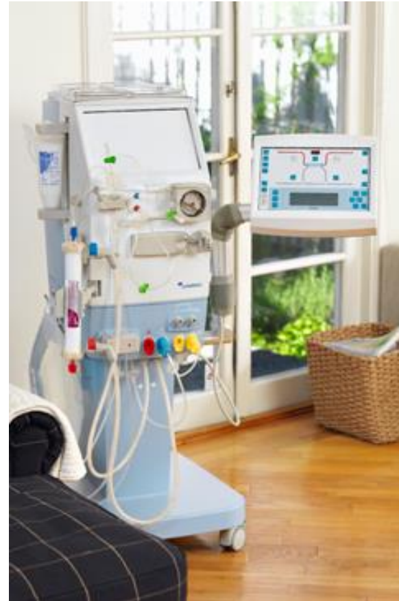
Gambro AK 96